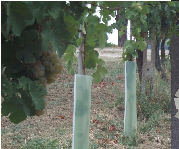
La gama de protectores disponible